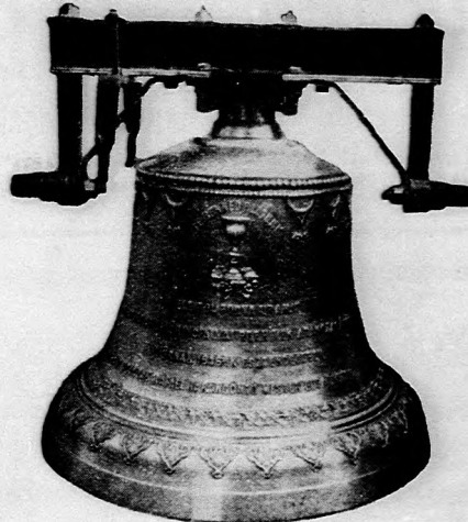
Garbolci református egyház harangja.

Készít: új harangokat, harang vaskoronákat és vasállványokat, repedt harangokat újra átönti legjutányosabb árak s kedvező fizetési feltételek mellett.