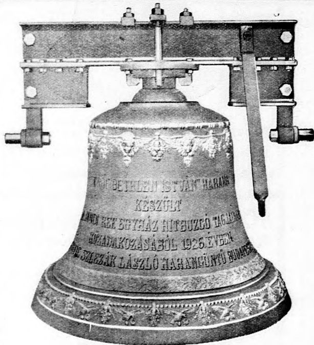
Jándi református egyházközségnek szállított 598 kilogrammos „Gróf Bethlen István-harang”

Magyar gyártmányú zománc-edények, zsír-bödönök, disznóölő-kések, húsvágó-gépek