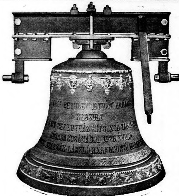
Jándi református egyházközségnek szállított 598 kilogrammos „Gróf Bethlen István-harang”

Magyar gyártmányú zománc-edények, zsír-bödönök, dísznődlő-kések, húsvágó-gépek.