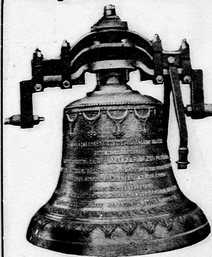
A nyírmártonfalvai ref. egyház 210 kg súlyú harangja