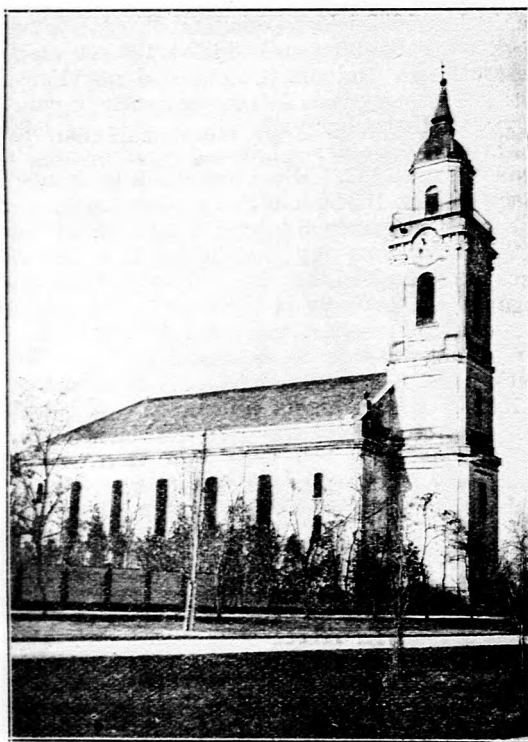
GYOMAI TEMPLOM. (Kívül.)

Ezeket átgondolva neveztem én Gyomát „építő gyülekezet”-nek és tudatosan használok e kifejezést nemcsak külső, hanem belső értelemben is, mert ahol hiányzik a belső megépülés, nincs ott külső építés