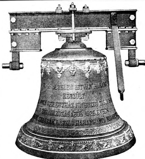
Jándi református egyházközségnek szállított 598 kilogrammos „Gróf Bethlen István-harang“

Magyar gyártmányú zománc-edények, zsír-bödönök, dísznőllő-kések, húsvágó-gépek.