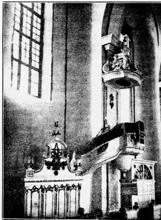
GYOMAI TEMPLOM. (Belső.)

nyilvánítására maga a Műemlékek Országos Bizottsága tett előterjesztést. A XIX. század alkotásai a gyönyörű parókiák és a modern igényeket is teljesen kielégítő iskolaépületek. Míg a ma élő emberekre, a XX. század világháborút megjárt nemzedékre, az a feladat vár, hogy kívül-belül restaurálja