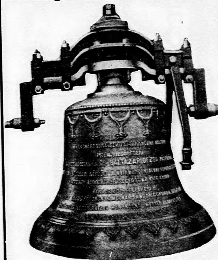
A nyírábrányi ref. egyház 210 kg súlyú harangja