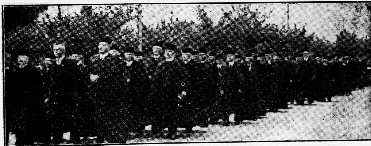
Palástos lelkeszek a temetésen.

Az ő magas ór helyén szinte minden pillanatban nagy problémákat kellett mérlegelnie s eldöntenie