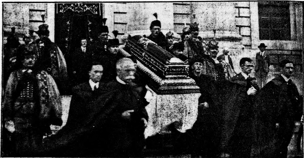
A Nagytemplomból indulnak a koporsóval.