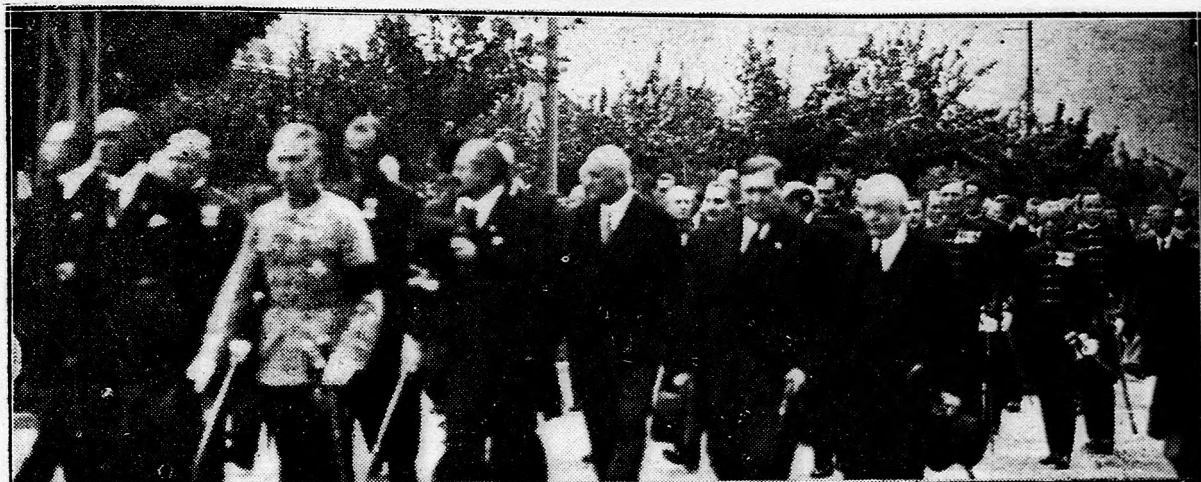
A kormány és honvédelmi miniszter-képviselői, egyházi és világi előkelőségek a temetési menetben.

megve haladtunk végig a Jézus kálváriaútján: de amaz utolsó szó, immár nem a délibáb remegésével, hanem a diadalmas hit kőszikla bizonyosságával állítson oda bennünket Isten trónja zsámolyához, ahol feltáruul az idvezült lélek előtt az örökkévalóság templomajtaja.