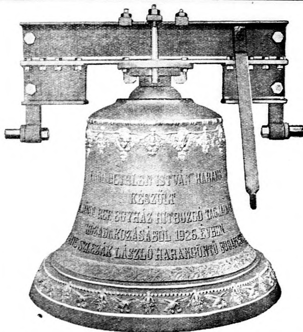
Jándi református egyházközségnek szállított 598 kilogrammos „Gróf Bethlen István-harang“

Magyar gyártmányú zománc-edények, zsír-bödönök, disznóölő-kések, húsvágó-gépek.