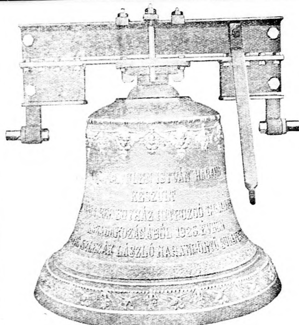
Jándi református egyházközségnek szállított 598 kilogrammos „Gróf Bethlen István-harang“

Magyar gyártmányú zománc-edények, zsír-bödönök, disznóölő-kések, húsvágó-gépek