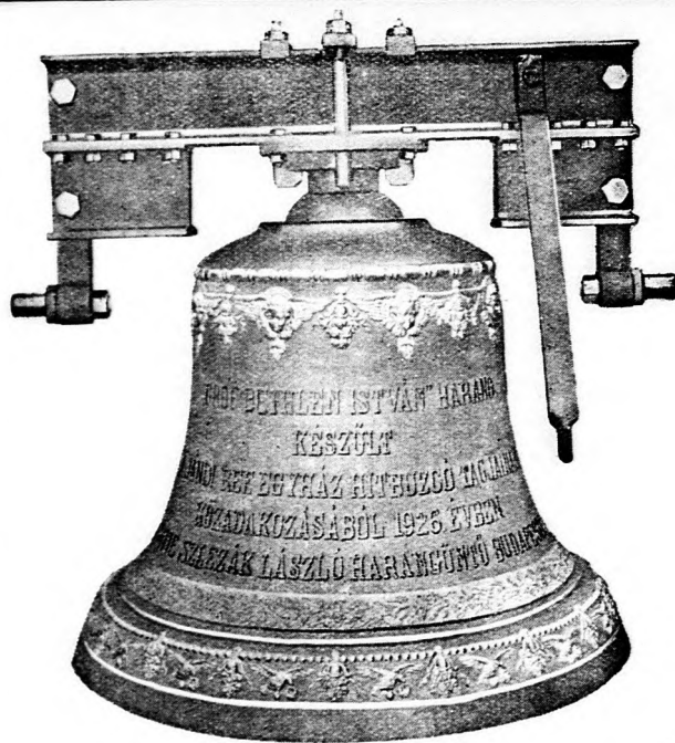
Jándi református egyházközségnek szállított 598 kilogrammos „Gróf Bethlen István-harang“

Magyar gyártmányú zománc-edények, zslr-bőrdönők, dísznőző-kések, húsvágó-gépek.