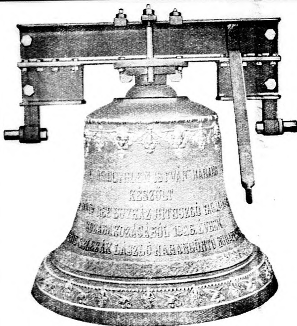
Jándi református egyházközségnek szállított 598 kilogrammos „Gróf Bethlen István-harang“

Magyar gyártmányú zománc-edények, zsír-bödönök, dísznövelő-kések, húsvágó-gépek.