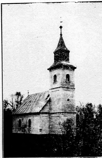
Tivadari református templom.

A templom ma is jókarban van és elég a híveknek. Barokkstilusú, kórusa magyaros rokokó. A fatornyot 1938-ban, a nyár végén elbontottuk és egy huszonnyolc méter magas bádogtetős új kőtornyot építettünk, Isten kegyelméből, a legnehezebb időben, egy európai háborús vihar előszelének állandó zúgása s idehallatszó ágyúdörgések, ellenséges repülő betörései közben, a trianoni határszélén: Beregben. Ez a harmadik tornyunk a református