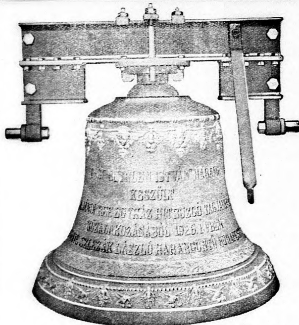
Jándi református egyházközségnek szállított 598 kilogrammos „Gróf Bethlen István-harang“

Magyar gyártmányú zománc-edények, zsr-bödönők, disznóölő-kések, húsvágó-gépek.