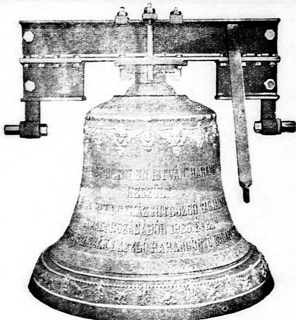
Jándi református egyházközségnek szállított 598 kilogr.-mmos „Gróf Bethlen István-harang“

Magyar gyártmányú zománc-edények, zsír-bödönök, dísznőrlő-kécek, húsvágó-gépek