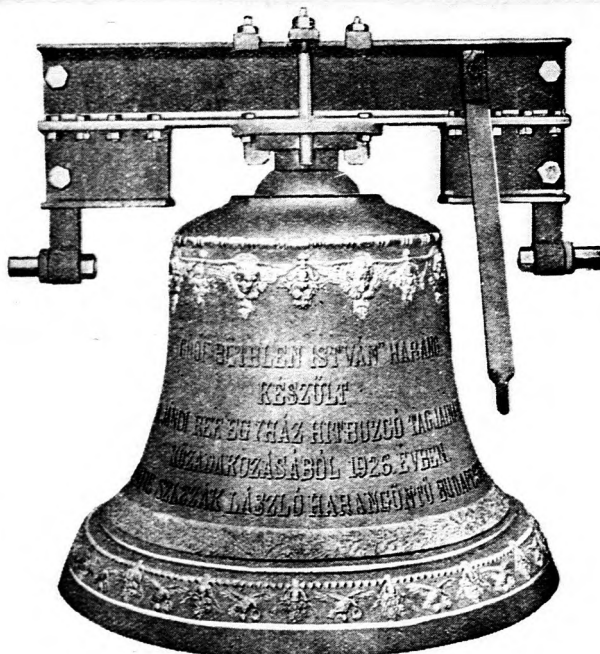
Jándi református egyházközségnek szállított 598 kilogrammos „Griffithen István-harang“