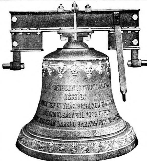
Jándi református egyházközségnek szállított 598 kilogrammos „Gróf Bethlen István-harang“