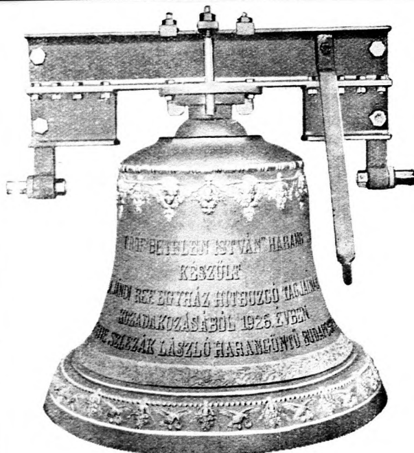
Jándi református egyházközségnek szállított 598 kilogrammos „Gróf Bethlen István-harang“