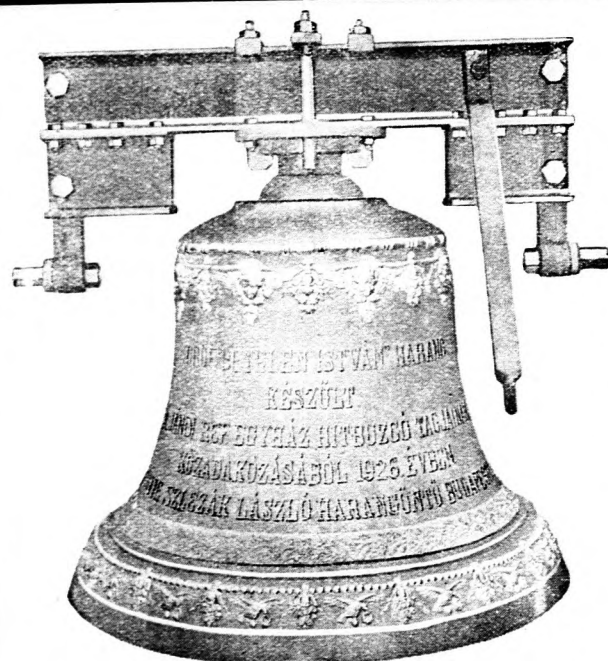
Jándi református egyházközségnek szállított 598 kilogrammos „Gróf Bethlen István-harang“