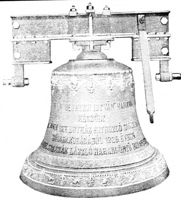
Jándi református egyházközségnek szállított 598 kilogrammos „Gróf Bethlen István-harang“