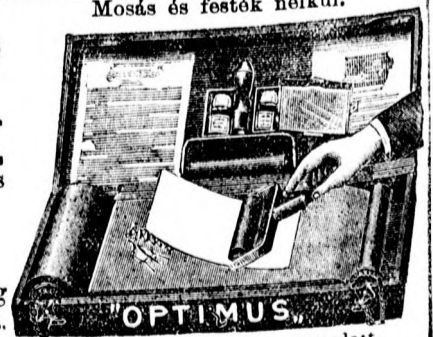
Mosás és festék nélkül.

„Smith Premie” írógépek képviselője. — Irógép kellek, u. m. Carbon papir, festék, szalag, Steneyl papir stb. minden rendszerű géphez raktáron.