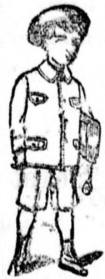
Iskola öltönyök 5-6 éves féléb.

Még sohasem létezett óriási választékban feltűnő árban vásárolhatók férfi- fiú- és gyermek-ruhák