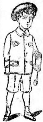
iskola öltönyök 5-6 K és feljebb.

elsőrangú katonai és polgári szabó-üzlete. bel- és külföldi szövetek, valamint hadi felszerelési cikkek raktára. Debreczen, Kossuth-utca 4-ik szám alatt.