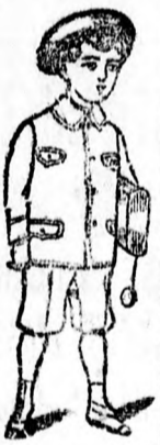
Iskola-ruhák 5-6 K és feljebb.