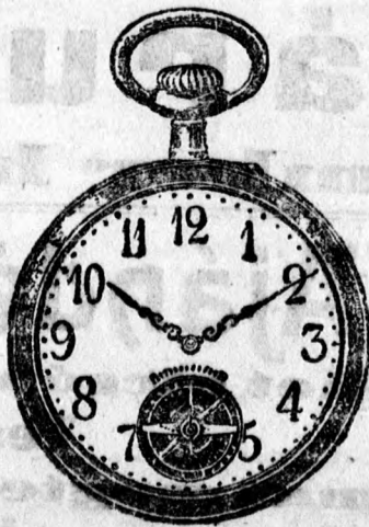
81 5 frt., ezüst 7 frt., arany 30 frt.