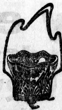
638 sz. ezüst 18 frt. chinaezüst 6 frt.