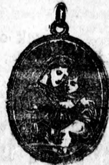
149 sz. Doublé 3 frt 50, arany 1 frt. kisebb ezüst 1 frt 20, arany 3 frt.

Szebbnél-szebb ujdonságok állandóan raktáron