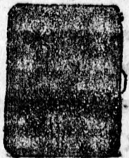
826. sz. Ezüst 8 frt., Chinaezüst 5 frt.