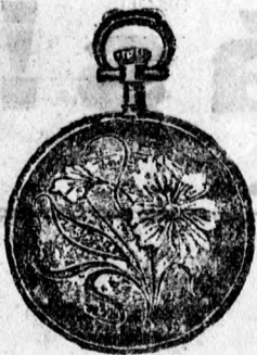
22. sz. Acél 5 frt., ezüst 6 frt., arany 14 frt.