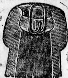
A Seal-dugóval elzárt üveg.

Midőn még a fogyasztó közönség szives figyelmét felhívom arra, hogy akár a fentemlített rendszerű elzárással, akár a cégbeégetés parafa dugóval ellátott üvegekben valódi „Dreher“-féle ser csupán az az itt látható védjegyes címkéssel kapható, — magamat a nagyérdemű vevőközönség szives párfogásába ajánlva, vagyok