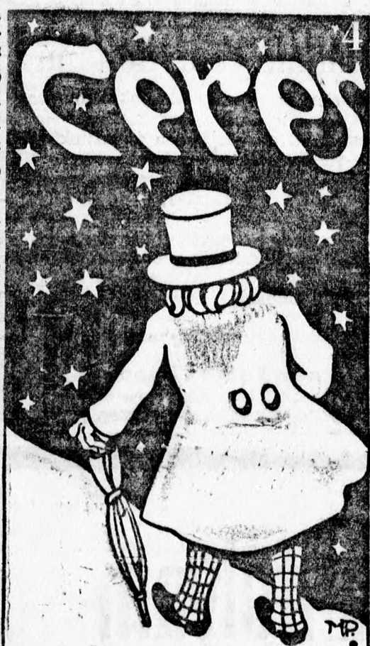
Fényesen tündöklök a csillagok közt hármeve a

Telefonszám 321. 170 Légszesz, vízvezeték, angol closett, csatornázás, szivattyu, a legmodernebb fürdőszoba berendezési, gőzfűtési, központi vízmelegítő berendezések, saját készítményű erős fürdőkádak raktáron, kőgyagy csövek raktáron; épület, bádigos munkák jóállás mellett és minden e szakmába előforduló javítások szakszerűen. gyorsan, jutányosan eszközölködnek.