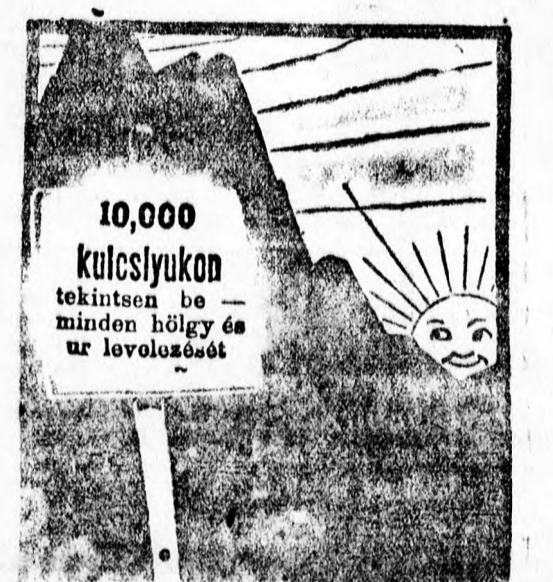
Mihály Sámuel Főtér 30. modern levélpapírján írja