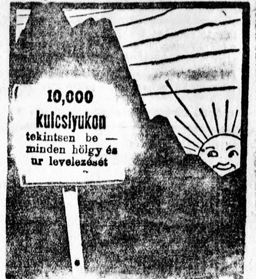
Mihály Sámuel Főter 30. modern levélpapírján írja

Kötszer és gummi-árak legolcsóbban kaphatók.