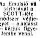
Az Emulsio valószínűleg a SCOTT-féle módszer védjegye - a halászt - kérjük figyelmezzünk.

és elősegíti fejlődésüket. Ily rendkívüli gyógyhatás valóban csak ilyen kiváló szerrel érhető el. A SCOTT csakis elsőrendű alkatrészeket tartalmaz a szeredeti SCOTT-féle eljárás okozza, hogy hatásában felülmulhatatlan és nemcsak fiatal és öreg, hanem még a halál küszöbén hitt gyermek is könnyen emésztheti.