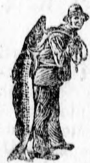
Az Emulsio vársárlásánál a SCOTT-féle módszer védjégyét — a halászt — kérjük figyelmebe venni.

a SCOTT-féle Emulsio hatása minden alkalommal, ha azt angolkórban szenvedő gyermeküknek adják. A SCOTT féle Emulsio feltűnő gyorsan izmosítja a gyermeket, erősíti a csontokat és elősegíti fejlődésüket. Ez a rendkívüli hatás valóban csak ilyen kiváló szerrel érhető el. A SCOTT csakis elsőrendű alkatrészeket tartalmaz és az eredeti SCOTT-féle eljárás okozza, hogy hatásában felülmúlhatatlan és nem csak fiatal és öreg ember, hanem még a halál küszöbén hitt gyermek is könnyen emésztí.