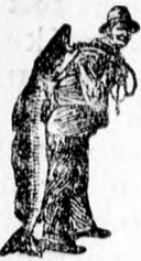
Az Emulsio vásárlásánál a SCOTT-féle módszer védelmét — a halászt — kérjük figyelembe venni.

Ezren és ezren tapasztalták ezt az utolsó 32 éven keresztül. Ép ily szembeötlő a javulás az általános egészséget illetően.