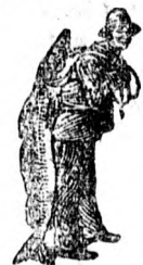
Az Emulsió vásárlásánál a SCOTT-féle módszer védegyét — a halászt — kérjük figyelembe venni.

ellensúlyozásul tessék SCOTT-féle Emulsiót használni, a mely VÉRT GAZDAGITJA és a test husát szilárdá és egészségessé teszi.