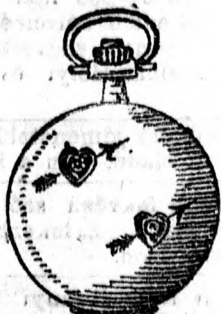
Igen erős tokban 2 valódi gyémánt megbizható szerkezet egyfedelű 28 forint, Ugyanez duplafedellel 44 forint.