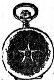
Elegáns kis alak, matt arany tokban 1 valódi gyémánttal 25 frt. Ugyanez duplafedellel 40 frt. Ugyanez 1 valódi briliánttal 55 forint.