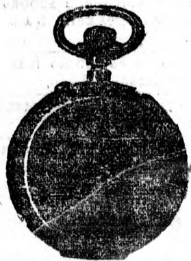
Egész sima 14 kar. aranytokban egyfedelű 14 frt. Ugyanez duplafedellel 24 frt. Ugyanez vaserős tokban egyfedelű 17 frt., duplafedellel 30 frt.

Magyarország legnagyobb óra, ékszer ezüstműi üzlete. 27 év óta áll fenn.