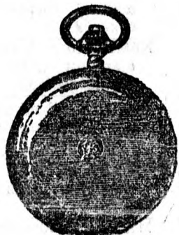
Elegáns sima óra legszebb lidabb tokban 1 valódi gyémánt kifogástalan szerkezet egyfedelű 27 frt. Ugyanez duplaf. 40 f. Ugyanez 1 valódi briliánttal 55 frt.