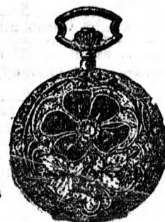
Művészién románcosított tokban legjobb szerkezet. tel egyfedelű 17 forint. duplafedellel 28 forint.