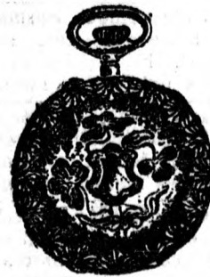
Dus vésésű erős aranytokban egyfedelű 14 frt. duplafedellel 24 frt. Ugyanez egész erős tokban legmegbizhatóbb szerkezettel egyfedelű 18 frt. duplaf. 38 frt.

Megérkeztek szebbnél-szebb újdonságok, órákban, ékszerekben ezüstműekben.