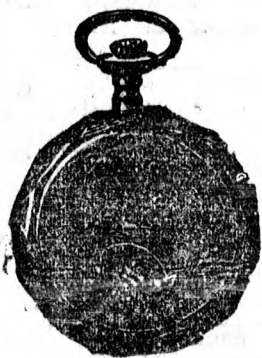
Legdivatosabb arany női óra művészi románcosású fedellel, facettírozott szegéllyel egyfedelű 18 frt. Ugyanez duplafedellel 34 forint.