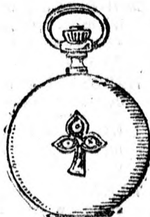
Nagyon kedvelt facou, sima tokban 3 gyémánttal löhere alakban igen erős duplafedellel 40. f. Ugyanez valódi briliántokkal 70 frt.