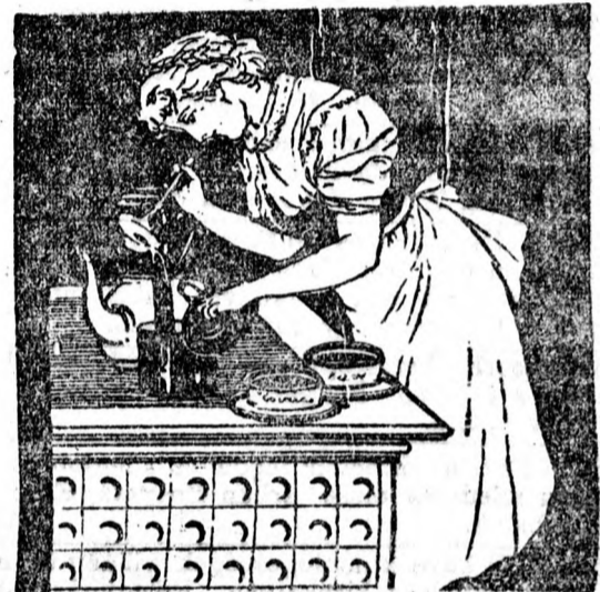
Király kávéja mégis a legjobb.