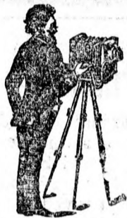
Fénykép készítőket és kelleket.

előnyomda és kézimunka üzletében Debrecen, Piac-utca 12. sz.