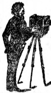
Fénykép készülékek és kellek.

divat-, vászon-, kézmű- és rövidárak- raktárában Piac-utca 28 sz. (a nagytőzsde mellett)