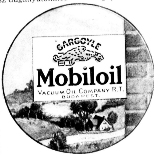
Ez a tábla mutatja, kinél kapható eredeti Gargoyle Mobilóil.

A helyes kenés a termelés nagyobb eredményességét biztosítja. A gazda akkor látja munkájának legtöbb hasznát, ha Gargoyle Mobilóilal ken.