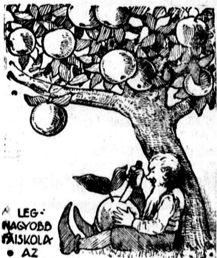
A LEGNAGYOBBI FAISKOLA AZ

hogy ezzel megszabaduljon az esetleges koronatanuktól. Hogy hogyan dolgozott, arra jellemző az a gyilkosságsorozat, amelyet egy majorságban követett el. Meggyilkolta a gazdát, a feleségét, négy gyermekét, magával vitte mindazt, amit erre érdemesnek tartott, aztán megölt még négy embert, akik a majorság közelében laktak s ezeket csak azért tette el láb alól, mert félt, hogy a rendőri nyomozáshoz adatokat szolgáltathatnak.