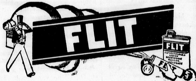
Sárga kanna fekete sávval.

kat és lárváikat, amelyek lyukakat ráganak a szövetekbe. Flit megóvja a ruhaneműket. Használata könnyű. Nem hagy foltot. Világhírű tudósok tökéletesítették a Flit rovarirtót. Biztos pusztulást hoz a rovarokra, de teljesen ártalmatlan emberre és háziállatra. Mindenütt kapható.