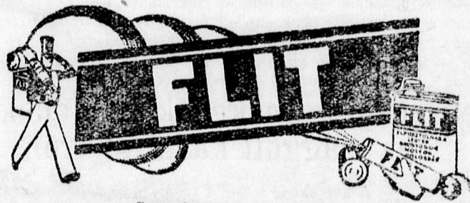
Sárga kanna fekete sávval.

kat és lárváikat, amelyek lyukat ráganak a szövetekbe. Flit meg-óvja a ruhaneműeket. Használata könnyű. Nem hagy foltot. Világhírű tudósok tökéletesítet-ték a Flit rovarirtót. Biztos pusztulást hoz a rovarokra, de telje-sen ártalmatlan emberre és házi-állatra. Mindenütt kapható.