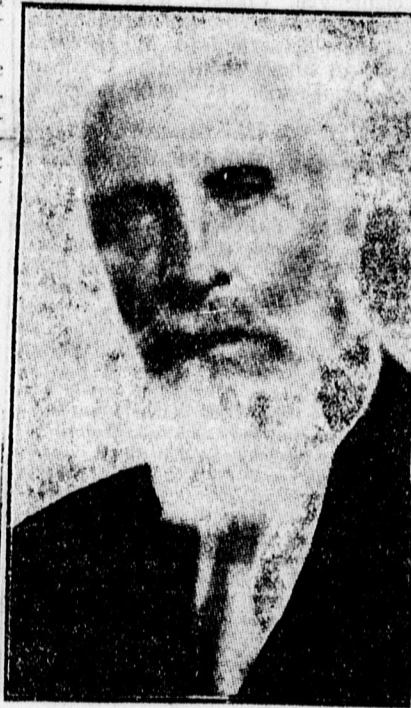
GRÓF APPONYI ALBERT

Az MTI Genfből jelenti, hogy délután 4.15 órakor gróf Apponyi Albertnél beállott az agónia.