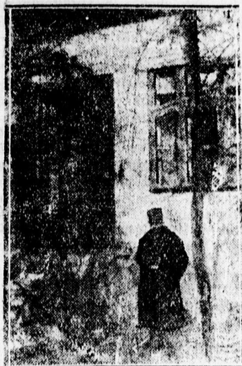
Ezen az ablakon másztak be a rablógyilkosok

sztettek és az utca felőli kerítés részen találtak egy mellénygombot és egy kabátgombot is. Itt volt lehajolva a kerítés belső pléh-része és nyilvánvaló, hogy a tettesek, — akik itt másztak ki a gyilkosság után — vesztették el a gombokat.