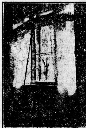
Az ablak belülről nézve