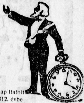
Alapítotott 1912. évbe

Csakis szolid, finom órák raktára DEBRECEN, CSAPO-UCCA 12. SZÁM