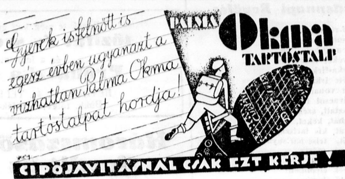
CIPŐJAVÍTÁSHOZ CSAK EZT KERJE!