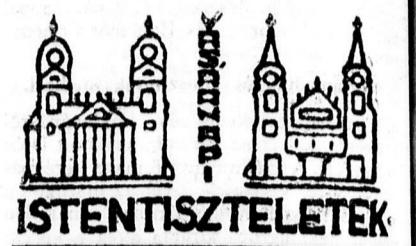
A református templomokban

A kamara épen ezért előterjesztést intézett a pénzügyminiszterhez, hogy a Budapestre nézve az újonnan emelt épületekre meghosszabbított 30 éves adómentességi kedvezmény határidejét Debrecenre nézve is hosszabbítsa meg, tehát azok az épületek, amelyek 1933. évi december végéig tető alá hoztak, a 30 éves rendkívüli adómentesség még megjellesse.