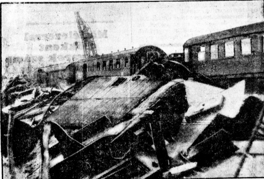
A franciaországi vasúti kajasztrófa

Gyöngyösi zamatos fehér 50 fill. Finom visontai vörös 54 fill. Gyöngyös-visontai rizling 60 fill. Gyöngyös gyöngye 66 fill.