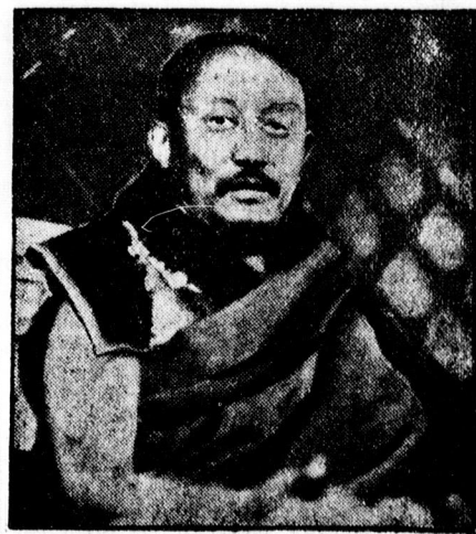
Visszhangozzák Azsiának a fülai mamát. Elfogalta hivatalát a dalaj láma!