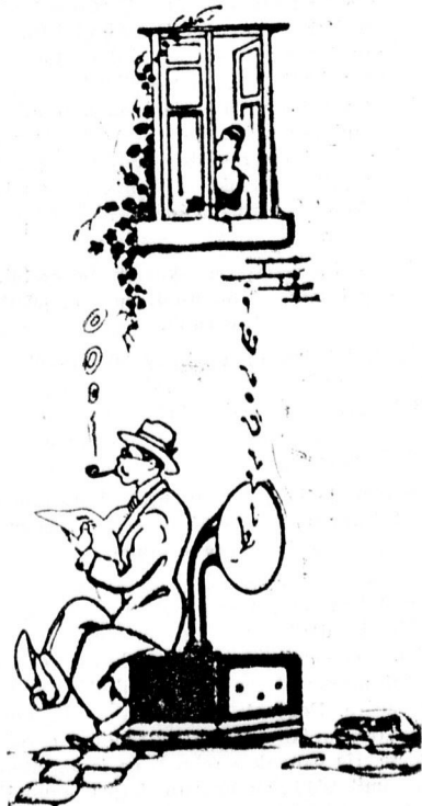
1934: Szereplők a Tisza-ház elől.