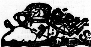
A debreceni egyetemi Meteorológiai Intézete jelentései december 29-én:

Rendőrségi telefonszám: 20-45. Munkák telefonszám: 0-4.