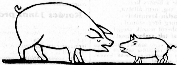
Szín: A basahalmi ói mélyében harsányan rőfög az ó-évi öregdísztó. Három tertáj őfélkor megjelennék az újévi kismalac. Immár a tizenkettedik. Vele együtt megvan a tucat.

Eseménydús beszámoló az 1934-ik (nem épen közönséges) esztendőről — Mit mond a pondrós szalonnájú ó-évi öreg dísztó?