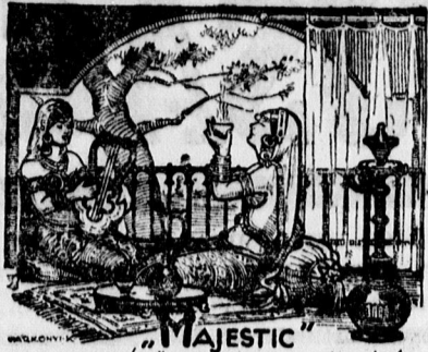
MAJESTIC TEAVEGYITÉKUNK INDIA VARÁZSÁT ÉS BÜBÁJÁT TARTALMAZZA A CSÉSZÉBEN KONTSEK GEZA

zett Mecsér András távirata, mely eképpen jelentette a csengeri győzelmet: