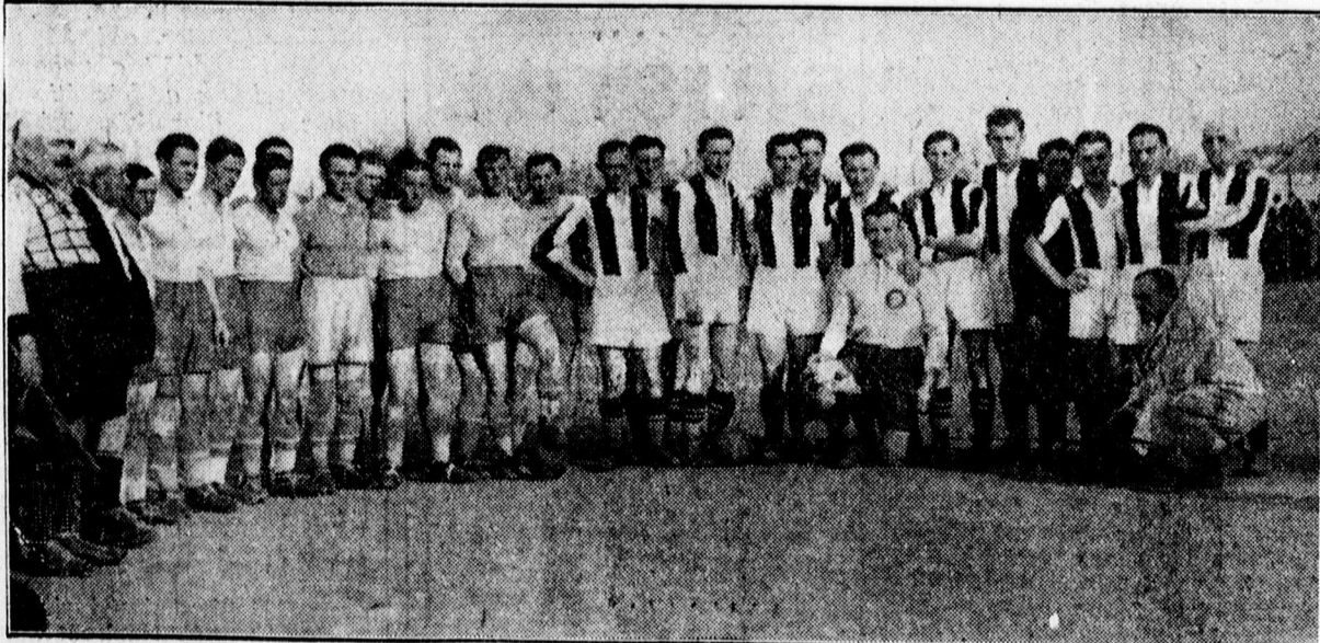
A DVSE és Beszkárt csapata.

Magda Schneider, Hermann Thimig attrakciója. — Megelőzi: VOLT EGY-SZER EGY KERINGŐ... Eggerth Mártha főszereplésével. — Előadások 6, fél 9 órakor.