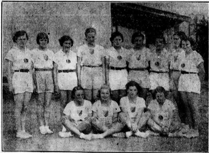
A hölgytornász csapat.

Az autó meglehetősen nagy sebességgel haladt a Kossuth Lajos-utcában s amikor befordult a keskeny Palatinus-utcába, hirtelen szembetalálta magát egy hatalmas bécsi autóbusszal, amely eltévedt Győrben s így került ebbe az utcába. A személykocsi teljes sebességgel nekirohant az autóbussznak és pillanatok alatt harmonikaszerűen összelapult.