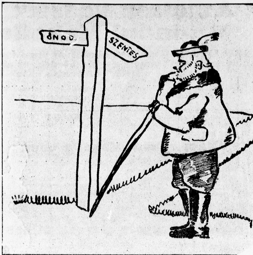
H. K. P.: „HÁT ÉN MERRE MENJEK?... — HÁT ÉN MERRE SZÁLLJAK?”