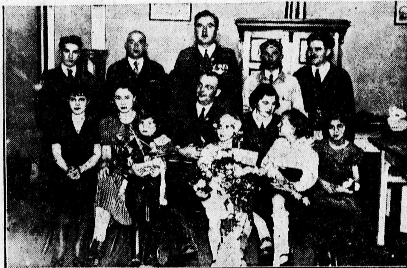
A március 15-iki ünnepély szereplői a Frontharcos Otthonban

— Az Ipartestület mészáros szakosztálya szerdán este 7 órakor az Ipartestületben ülést tart. Tárgy: Áregyezményi bizottság beszámolója. Pontos megjelenést kér az elnökség.