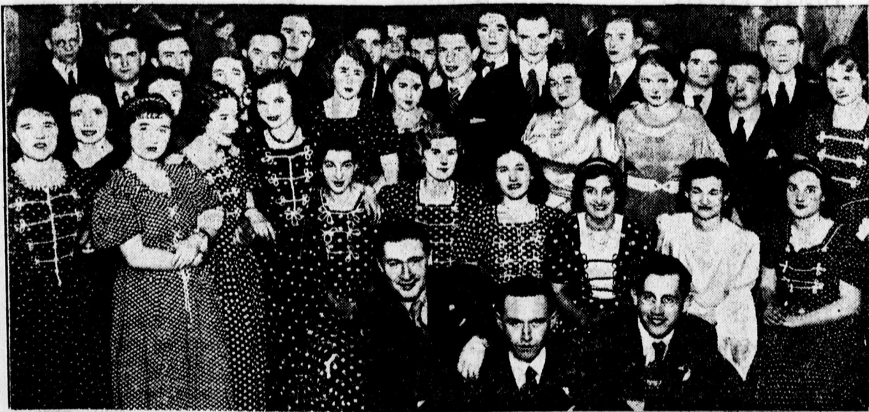
A Nemzeti Egység Leánycsoportja márciusi ünnepségnek közönsége a Kémalom-utca pártlyisegben