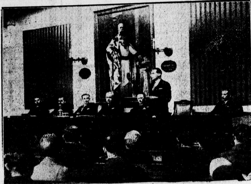
A Baross Gábor Szövetség március 15-i ünnepsége a Kereskedelmi és Iparkamarában

— Erdekes és nagyjelentőségű találmány az áramellátás tökéletesítésére. Sok olvasónknak, de a szakembereknek is kellemes meglepetésül fog szolgálni Nagy György okl. gépészmérnök és a debreceni Tisza István Tudományegyetemen is abszolvált fizikus találmánya, melynek befejezésén most dolgozik, de a tőle szerzett információk szerint az már hamarosan is forgalomba kerül. A találmány egy egyszerű és olcsó kis készülék, mellyel a hálózati feszültség-ingadozásokat lakásainkban harmadrésze csökkenthetjük. A találmánnyal lehetne még állandóbb feszültséget is biztosítani, de erre gyakorlatilag már nincs szükség. Különösen a rádiósoknak fog nagy szolgálatot tenni a találmány, mert sok rádióeszköznek fog hosszabb élettartamot biztosítani. A készüléknek kisebb, rádióhoz alkalmas alakja csak annyiba fog kerülni, mint egy jobb rádióeszköz. Nagy jelentősége van a találmánynak ritkán lakott területek világítási ellátásánál is, ahol gazdasági okokból nem lehetett a hálózatot úgy méretezni, hogy erős hálózati ingadozások fel ne lépjenek. Reméljük, hogy ezen készülék gyártása hamarosan megindul s előnyei mellett városunkban új munkalehetőséget is létesít. A feltaláló különben mint ösztöndíjas itt folytatta tanulmányait a fizika—matematika szakon s jelenleg a műszaki doktorátusra készül. Doktorai értekezése is újszerű, az elektromos mérőtechnikát helyezi új alapokra.