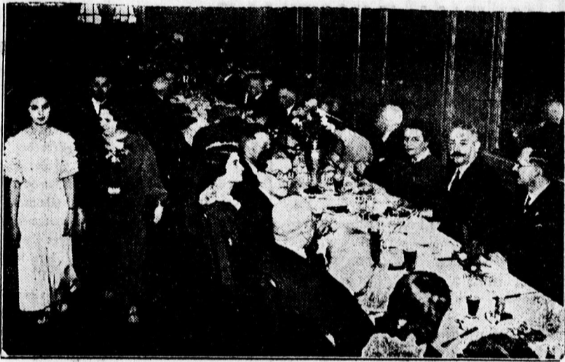
A Kölesönössegélyző vacsora az Angol Királynőben

A Ház legközelebbi ülését ma délután 4 órakor tartja. Az elnök bejelentette, hogy a szerdai ülésen 7 órakor térnek át az interpellációk meghallgatására.