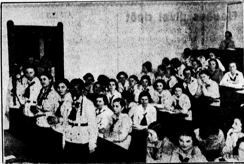
Gázvédelmi vizsga a debreceni Dóczi intézetben