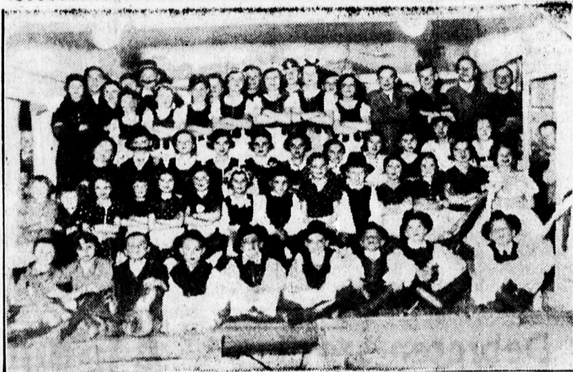
A tégláskerti állami elemi iskola hazafias ünnepélyének szereplői

A MÁV azt kéri, hogy napi egy járat induljon Zsolcán, Ónodon, Sajóladán, Muhia, Hajdúszörményen keresztül Debrecenbe és vissza. A hétfévi napokra két forduló kér a MÁV. Ugyanekkor beadta kérvényét a Debreceni